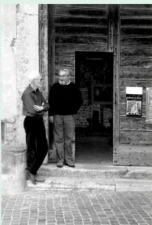
Sopra: L'artista francese davanti alla chiesa di San Bartolomeo. Di fianco: una sua opera